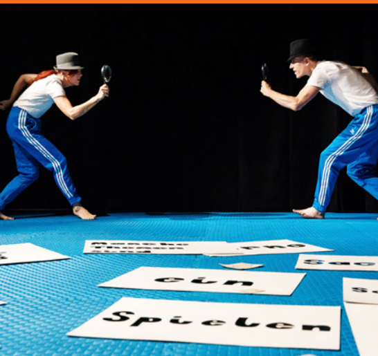
La Rasa Tabu